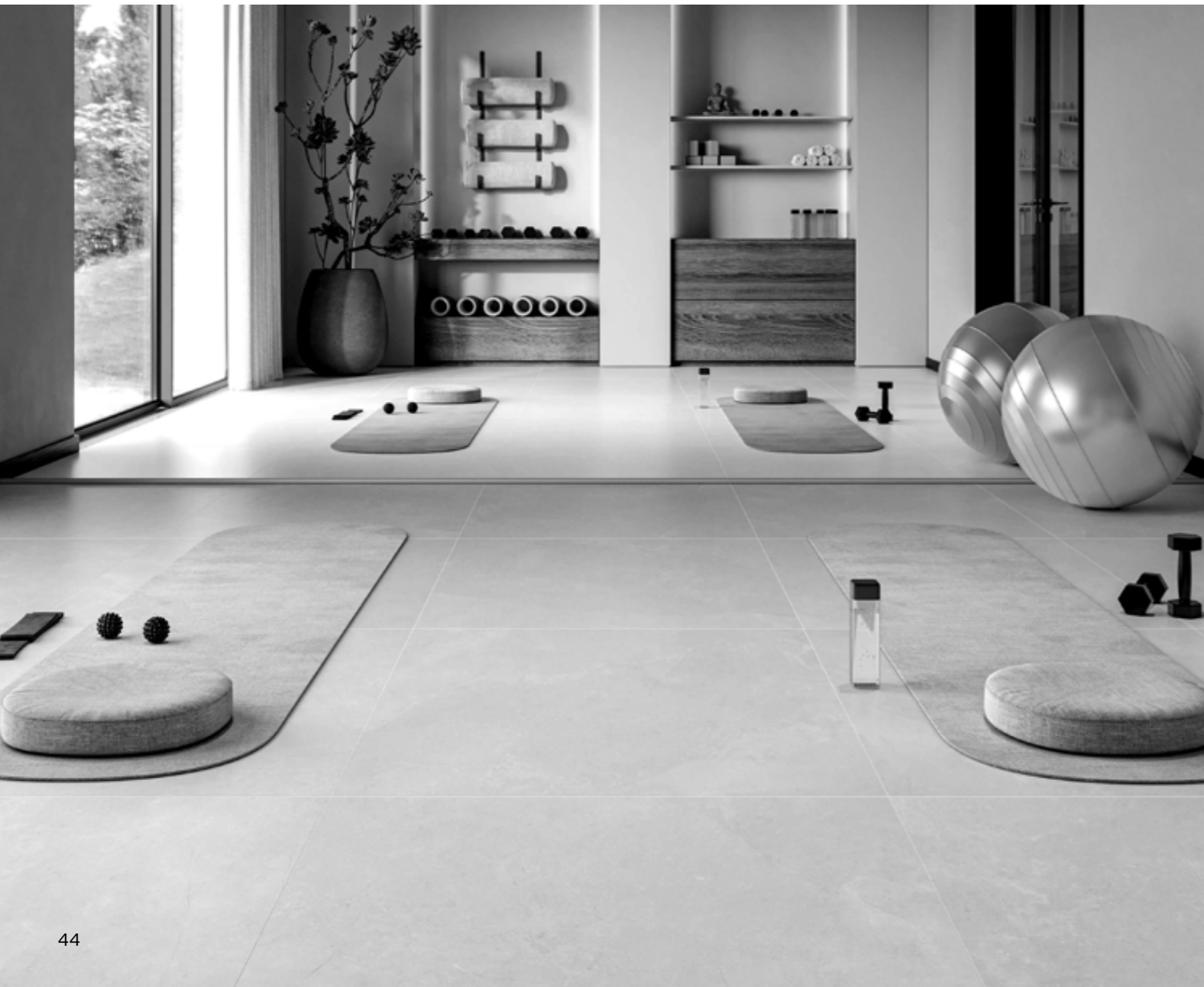
TABELA 20 – INDICAÇÃO DE USO: ACADEMIA

A tabela 20 mostra as especificações de uso dos revestimentos cerâmicos para as diferentes áreas das academias. Deve-se sempre notar que o tamanho do empreendimento comercial é um fator a ser avaliado mesmo com as indicações descritas, já que ele está diretamente relacionado com a quantidade de pessoas que circulam no local e, conseqüentemente, com o grau de resistência que o produto deverá apresentar.